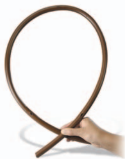
Maximální délka závlahové linky (metry)