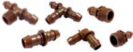
FX Dripline nástrčné tvarovky (str. 114)