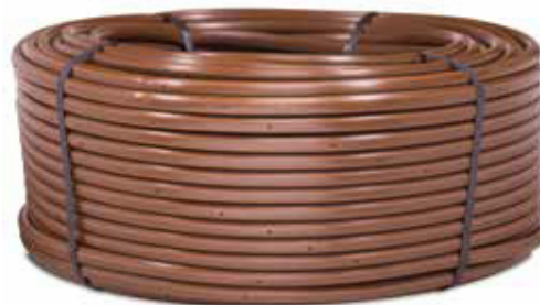
XFD Dripline kapkovací potrubí