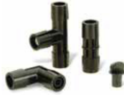
Easy Fit tvarovky (str. 115)