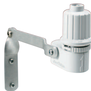
RSD-BEx Čidlo srážek