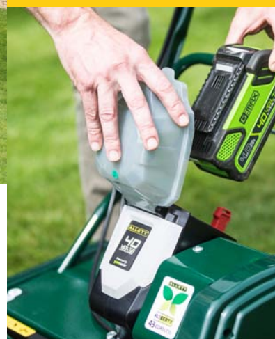
Vřetenová sekačka Allett Liberty 43 na bateriový pohon